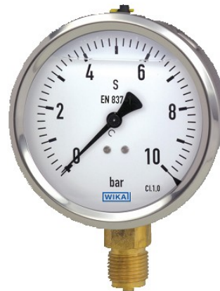
Manometry z rurką Bourdona model 213.53.100 przyłącze radialne